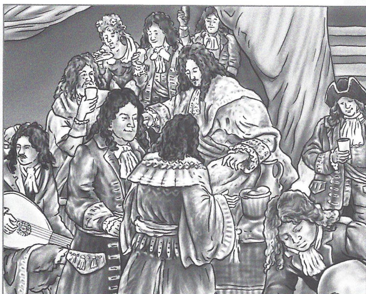
Aan het hof van Lodewijk XIV.

Koning Lodewijk XIV van Frankrijk was dol op feesten. Hij woonde in een enorm paleis in Versailles. Aan zijn hof was dagelijks wel een feest. In die tijd werd de bevolking ingedeeld naar standen. De eerste stand waren de priesters en de monniken. De tweede stand was de adel: graven, hertogen, baronnen. En de derde stand waren de burgers, waaronder ook de grote groep boeren. De burgers en boeren moesten flink belasting betalen voor de feesten, oorlogen en luxe van de koning. Onder de volgende Franse koningen stegen de belastingen verder. Het volk werd steeds ontevredener. Ze wilden meer macht en, net als de burgers in Amerika, hun eigen land regeren. De Franse burgers maakten ook een moderne grondwet. Ze wilden 'vrijheid, gelijkheid en broederschap'. In 1789 bestormden ze in Parijs de Bastille, de koninklijke gevangenis. De Franse revolutie was begonnen.